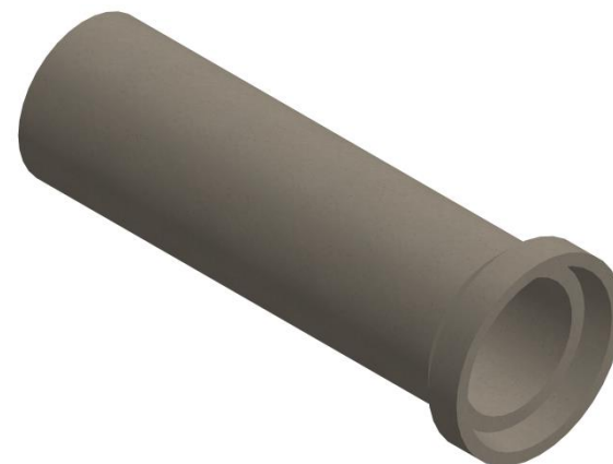
DETALLE VISTA 3D

Se informa además que Bottai S.A. cuenta con certificación permanente del Centro de Medición y Certificación de Calidad (CESMEC), aplicando el modelo ISO/CASCO N°5.