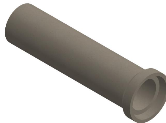
DETALLE VISTA 3D

Se informa además que Bottai S.A. cuenta con certificación permanente del Centro de Medición y Certificación de Calidad (CESMEC), aplicando el modelo ISO/CASCO N°5.