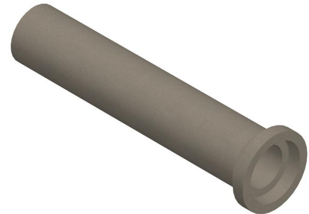
DETALLE VISTA 3D

Se informa además que Bottai S.A. cuenta con certificación permanente del Centro de Medición y Certificación de Calidad (CESMEC), aplicando el modelo ISO/CASCO N°5.