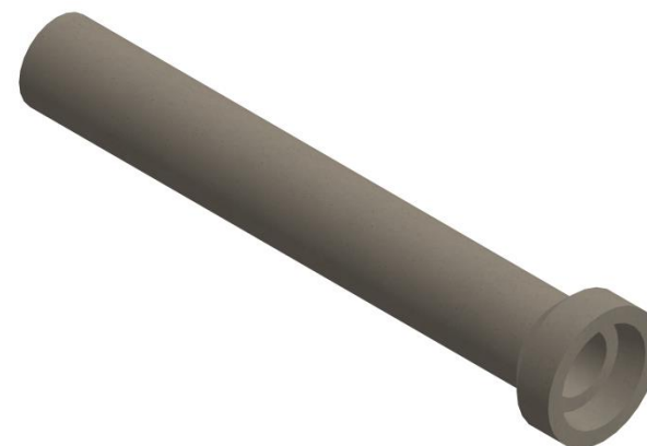
DETALLE VISTA 3D

Se informa además que Bottai S.A. cuenta con certificación permanente del Centro de Medición y Certificación de Calidad (CESMEC), aplicando el modelo ISO/CASCO N°5.